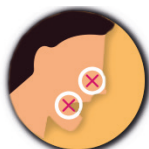
Perte de goût & de l'odorat