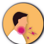
Maux de gorge