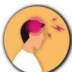
Maux de tête